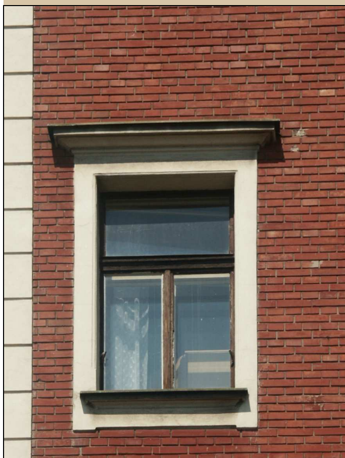
celkový pohled z exteriéru