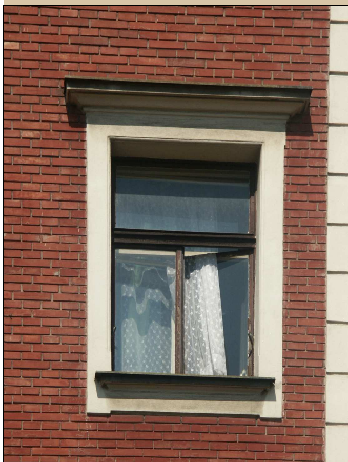
celkový pohled z exteriéru